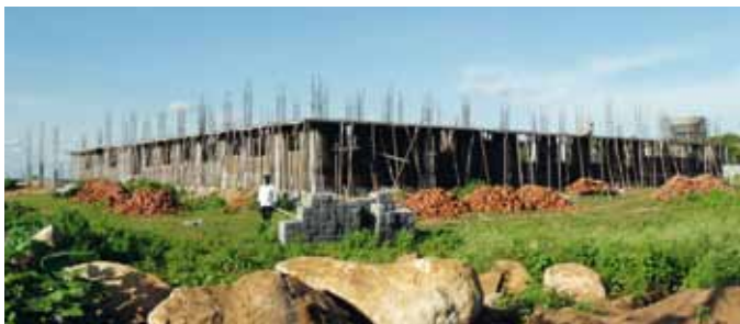
Andhra Rani nel novembre del 2010: lavori in corso