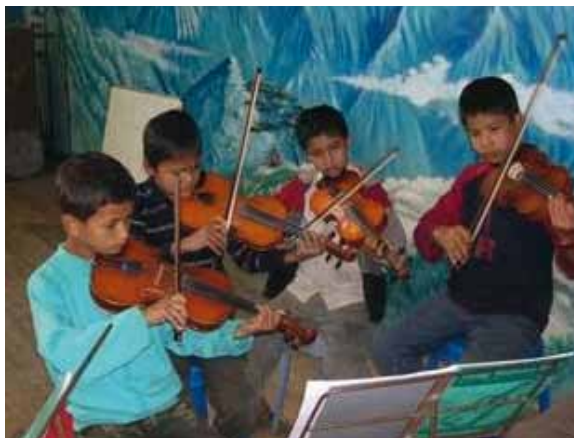
Melodie della nostra orchestra d'archi di Gandhi Ashram

Ci sono ancora diversi padrini della prima ora, padrini che si sono visti "recapitare" parecchi bambini, passando dall'India, magari dal Nepal per poi finire in Thailandia. Padrini e madrine (non me ne vogliono i "nuovi") che sono davvero nel mio cuore e ai quali sono infinitamente riconoscente, poiché ammettiamolo, è molto più facile aiutare e credere in Arcobaleno (dal Alex Pedrazin) oggi che non vent'anni fa..!! Claudio chi? Chi ca l'è chel lì? A questi padrini dei quali potrei scrivere il nome, va il mio saluto e tributo speciale. Sono sicuro che Arcobaleno continuerà per molti anni ancora.