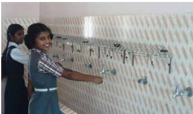
I nuovi bagni e la nuova mensa